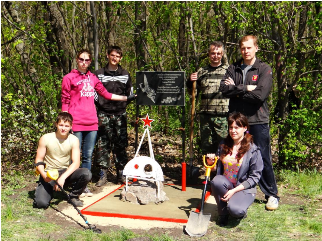
У Памятного знака экипажу ПЕ-2